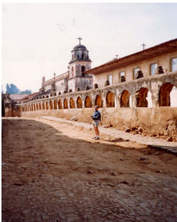
Patzcuaro, El Sagrario

Una dintre primele preocupări esențiale ale spaniolilor, după cucerirea Imperiului aztec a fost aceea de a înlocui templele păgâne cu numeroase biserici catolice (spre exemplu Puebla și Cholula, în statul Puebla). Orașele construite de aceștia sunt de asemenea monumente de arhitectură și urbanism (cu străzi perfect delimitate, precum în Puebla, Morelia, Campeche sau Merida), pline în permanență de viață. Aici muzica poate fi întâlnită pe orice stradă, în orice piață, în orice autobuz. Ea este un mod de viață, iar grupurile marimba (xilofon dublu din lemn pentru patru muzicieni) sau grupurile mariachi (trompetă, vioară, chitară, voce) aduc culoare oricărei petreceri în aer liber.