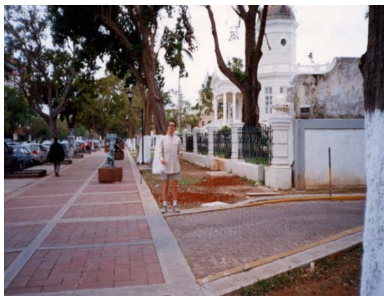
Merida, Paseo Montejo

Acoperind circa două milioane km 2 , în Mexic se întâlnesc toate formele geografice și topometrice. Climatul este arid și secetos în nord, blând și umed în sud și est, mai ales între mai și octombrie.