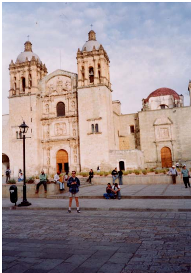
Oaxaca, Iglesia de Santo Domingo

Mexicul este o republică federală (Statele Unite Mexicane), alcătuită din 31 de state, având capitale proprii și un district federal (Ciudad de Mexico), divizate în 2394 municipalități. Congresul mexican (parlamentul) are două camere (Senatul cu 128 de membri și Camera Deputaților cu 500 de membri); președintele este ales prin vot direct iar la baza puterii judecătorești stă Codul lui Napoleon.