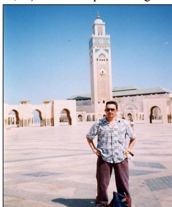
Casablanca Moscheea Hassan II,

Ca religie , interesate sunt, în primul rând, izvoarele islamului . Acestea sunt în număr de patru: Coranul (în limba arabă, recitare), povestea vieții lui Mahomed , Sunna Profetului , care se referă la comportarea lui Mahomed, și două izvoare de origine profană, ijmâ , consensul doctorilor legii și qiyâs , raționamentul prin analogie.