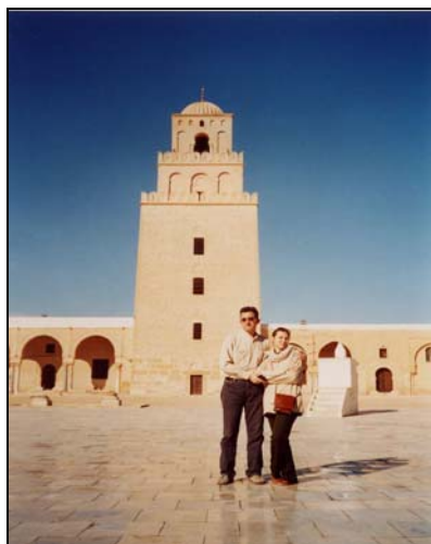
Kairouan, Marea Moschee (Okba)

Islamul este a treia mare religie monoteistă, după iudaism și creștinism și a apărut în lumea arabă în secolul al VII-lea. Cuvântul islam desemnează religia monoteistă întemeiată de profetul Mahomed și care are la bază Coranul . Termenul de islam definește, de asemenea, spațiul, totalitatea țărilor și popoarelor islamice, iar adepții săi se numesc musulmani sau mahomedani . Rădăcina cuvântului islam este aslama , a se supune, a fi pătruns de pacea lui Dumnezeu. Cuvântul musulman înseamnă supus întru totul lui Allah . Islamul fiind o religie revelată, musulmanii consideră că adevărata religie este islamul, mesajul ultim al lui Dumnezeu fiind revelat profetului Mahomed. Acesta a fost, așadar, întemeietorul religiei islamice, influențat, însă, de monoteismul ebraic, de creștinism, de zoroastrism.