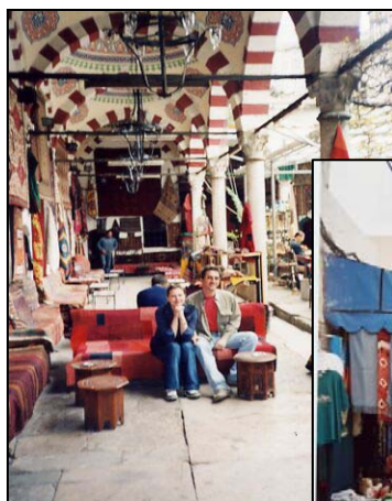
Istanbul, Marele bazar

Epoca de aur a civilizației islamice este considerată ca fiind rezultatul unei vocații universaliste a islamului, caracterizată prin umanismul perioadei cuprinse între secolele al VIII-lea și al XII-lea. Splendoarea islamului se datorează orașelor și vieții urbane și cosmopolitismului acestor societăți urbane. Mecenatul califilor, emirilor, guvernatorilor explică, în mare măsură, civilizația islamică. În lumea musulmană, străzile se curățau cu regularitate, băile publice abundau, iar controlul sanitar al alimentelor era obligatoriu – elemente specifice și islamului modern. Entuziasmul intelectualilor musulmani a determinat dezvoltarea științelor exacte și a celor naturale , iar, ca urmare a contactelor cu îndepărtata civilizație chineză, aceștia foloseau, pentru scris, hârtia. Islamul s-a dovedit a fi o religie superioară, cu un accentuat rol misionar, dar și cuceritor. Acestui spirit științific și educativ i se datorează apariția, în întreaga lume islamică, a moscheelor , dar mai ales a moscheelor-școală , care serveau, adesea, drept spital pentru comunitate, azil pentru cei fără adăpost și pentru cei vârstnici, școală pentru copii și baie publică și ritualică.