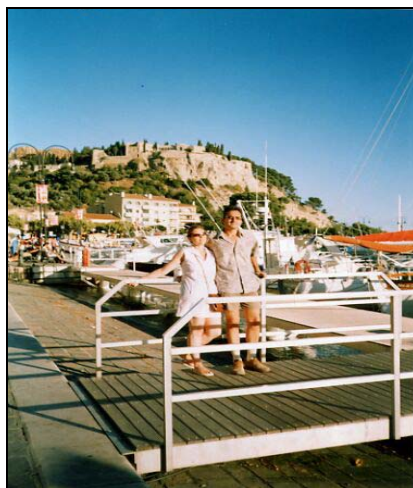
Cassis, lângă Marseille

Pe malul Rhonului, spațiu de origine celtică, colonizat apoi de greci, Arles a devenit oraș roman grație lui Cezar, care l-a destinat veteranilor legiunilor sale. Mică Romă a galilor, Arles este încă din zorii creștinismului un important centru religios. Cele mai importante dintre monumentele sale romane fac parte astăzi din patrimoniul mondial al UNESCO.