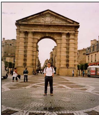
Bordeaux, spre rue Sainte Catherine

Încă din secolul al III-lea, Bordeaux, „Mica Romă” era un oraș galo-roman prosper. Evul Mediu a fost epoca de expansiune economică a orașului, grație comerțului cu vin. Bordeaux este situat pe drumul pelerinilor spre Santiago de Compostela și multe dintre monumentele sale sunt înscrise astăzi în patrimoniul mondial al UNESCO. În secolul al XVIII-lea urbanii și arhitecții inspirați au transformat orașul sub impulsul intențenților regali. Astăzi, amenajarea malurilor fluviului Garonne este obiectul unui mare proiect urbanistic al primăriei orașului, axa în jurul căreia trăiește centrul vechi al orașului. Acest spațiu unic, unul dintre cele mai frumoase din oraș, aproape de cea mai mare piață deschisă din Europa, primește escalele pacheboturilor și vapoarelor de croazieră. Mare centru universitar, Bordeaux găzduiește facultăți care pregătesc specialiști în toate domeniile vieții economice și sociale.