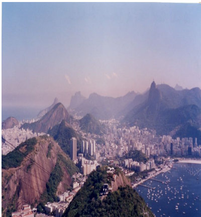
Rio de Janeiro