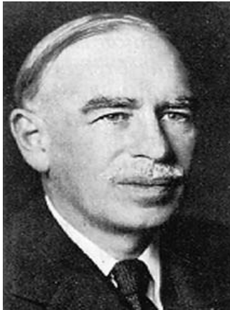
John Maynard Keynes 1883-1946